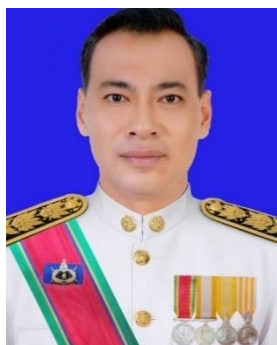
นายชรินทร์ ทองสุข รองผู้ว่าราชการจังหวัดนครราชสีมา